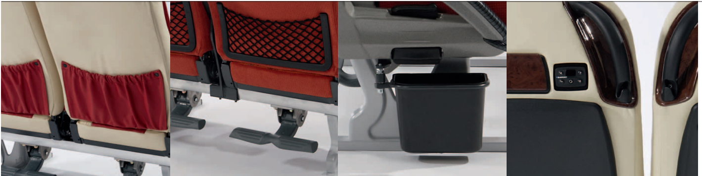
11 Audiomodul Audio module Commande pour réglage audio

Die vielfältigen, optionalen Anbauteile bieten die Möglichkeit den Sitz wunschgemäß auszustatten.