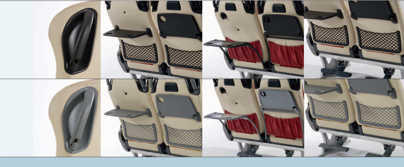
07 Zeitungsnetz Magazine net Filet porte-revues